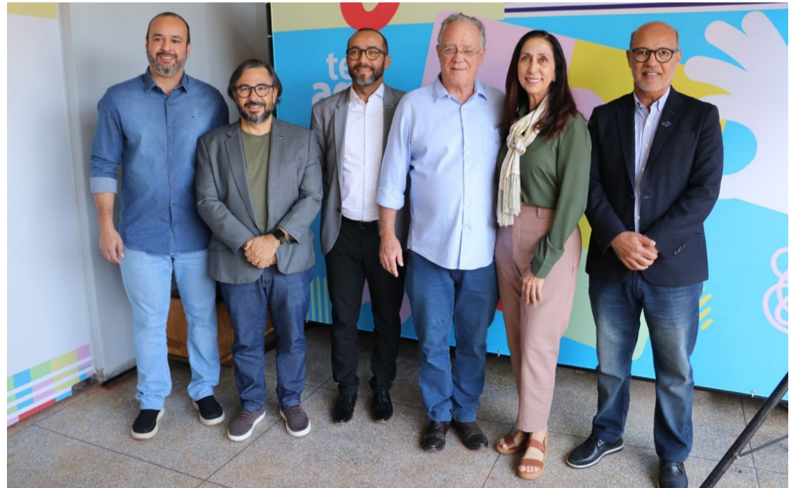
O Centro Teia, inaugurado em Rio Verde, é a primeira unidade a funcionar fora da região metropolitana da capital — Foto: Reprodução.