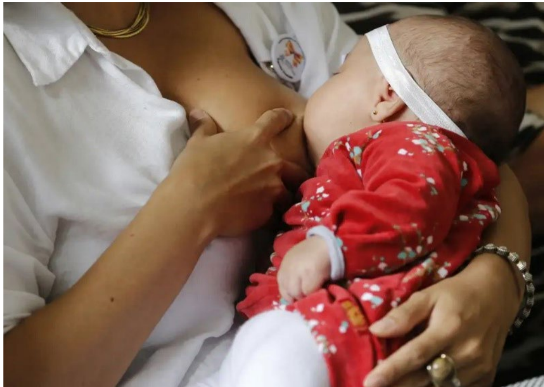
Banco de Leite Humano recomenda aleitamento materno por dois anos

Estudo publicado na Revista Cancer Medicine indicou que cada 12 meses de aleitamento materno pode reduzir em 4,3% a possibilidade de desenvolver câncer de mama