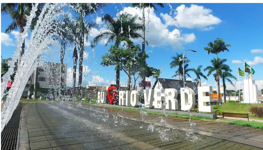
A Prefeitura de Rio Verde divulgou a programação oficial do 176º aniversário da cidade, com eventos de 1º de agosto a 21 de setembro — Foto: Reprodução.

1 a 3 de agosto VNT Etapa Rio Verde: Corridas emocionantes no Autódromo Municipal de Rio Verde. 4 de agosto 22h: Show de Israel & Rodolfo no Complexo Esportivo Bairro Veneza. 5 de agosto - Solenidades oficiais do aniversário da cidade 05h: Alvorada na Praça 5 de Agosto. 10h: Som Automotivo no Autódromo. 21h: Show de Isaías Saad, no Complexo Esportivo Bairro Veneza. 10 de agosto 14h: Encontro de Carros Antigos no Espelho D'água. 20h: Show da banda Rivotril. 7h: Final Amador Série A no Módulo Esportivo. 11 de agosto Carros Antigos: Evento especial comemorando o Dia dos Pais.