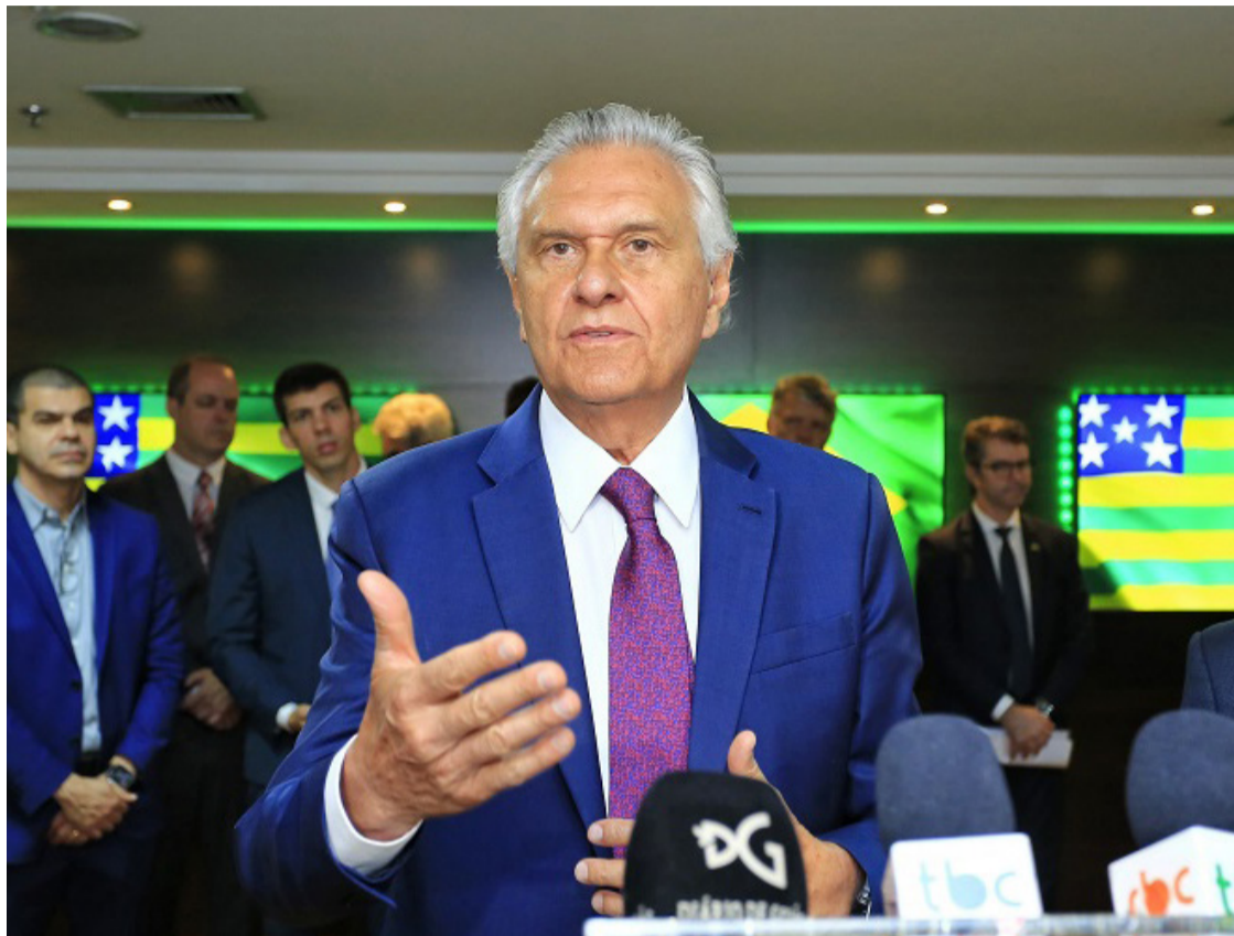
Ronaldo Caiado: incertezas quanto à lisura das eleições na Venezuela

As eleições na Venezuela foram disputadas pelo atual mandatário do país, Nicolás Maduro, que busca sua terceira reeleição, e pelo representante da oposição, Edmundo González, apoiado pela principal líder opositorista, Maria Cori-