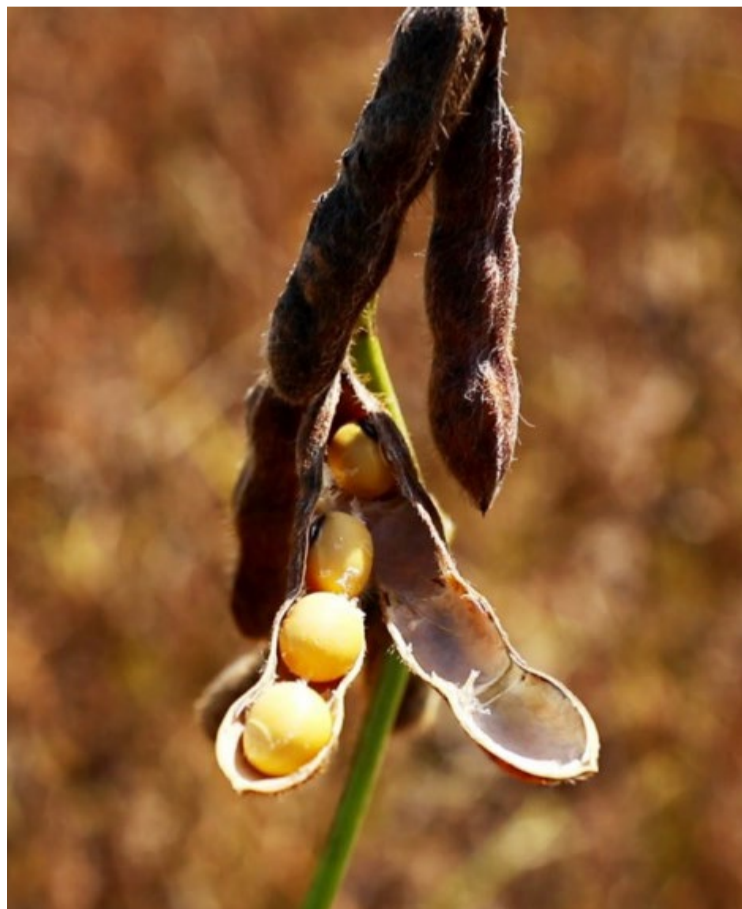
Safra 24/25 de soja de 166,6 milhões de toneladas é projetada por consultoria — Foto: Guilherme Soares/Canal Rural BA.

No total das duas safras, o Brasil tem previsão de área para 2024/25 de 20,749 mi de ha, 2% aquém dos 21,260 mi de ha da temporada 2023/24, e produção potencial de 116,959 mi de t, estável em relação à safra atual, de 117,008 mi de t.