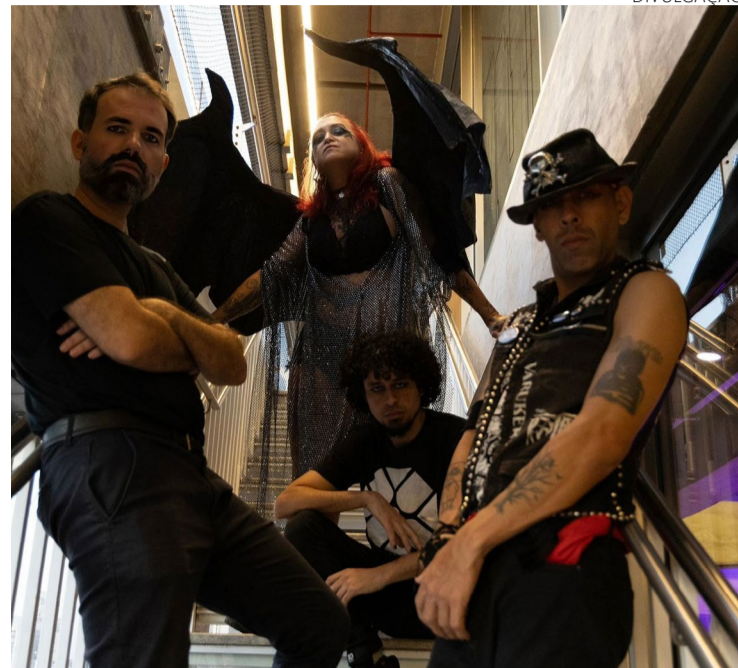
Carreira longa: grupo lançou nove discos de estúdio, um ao vivo e três DVDs