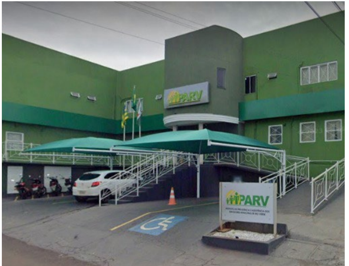
Aposentados e pensionistas do município poderão fazer a prova de vida online, sem precisar ir à sede do instituto para se recadastrar no mês de aniversário

O Instituto de Previdência e Assistência dos Servidores Municipais de Rio Verde - IPARV, é o órgão responsável pela execução da política municipal de previdência e assistência à saúde dos servidores públicos municipais, competindo-lhe, além de outras atribuições regulamentares, as seguintes: