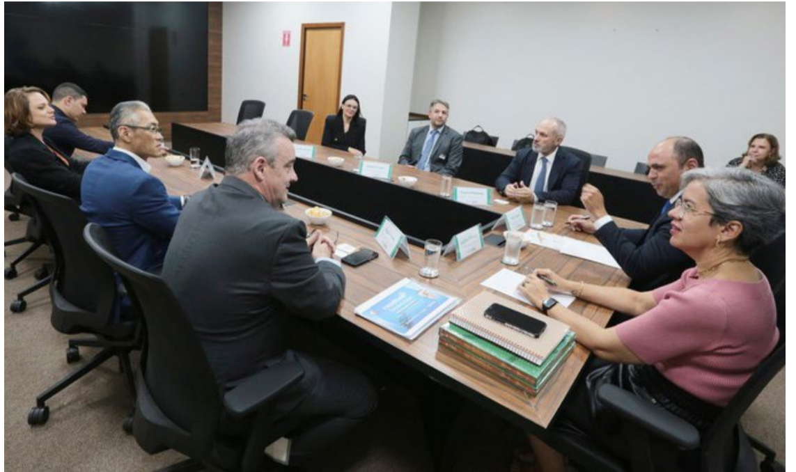
Os protocolos assinados representam o compromisso das instituições em trazer para a Rede Floresta+ ações colaborativas e integradas — Foto: Reprodução.

Segundo o presidente da IBÁ, Paulo Hartung, a participação da Indústria Brasileira de Árvores na Rede Floresta+ vem