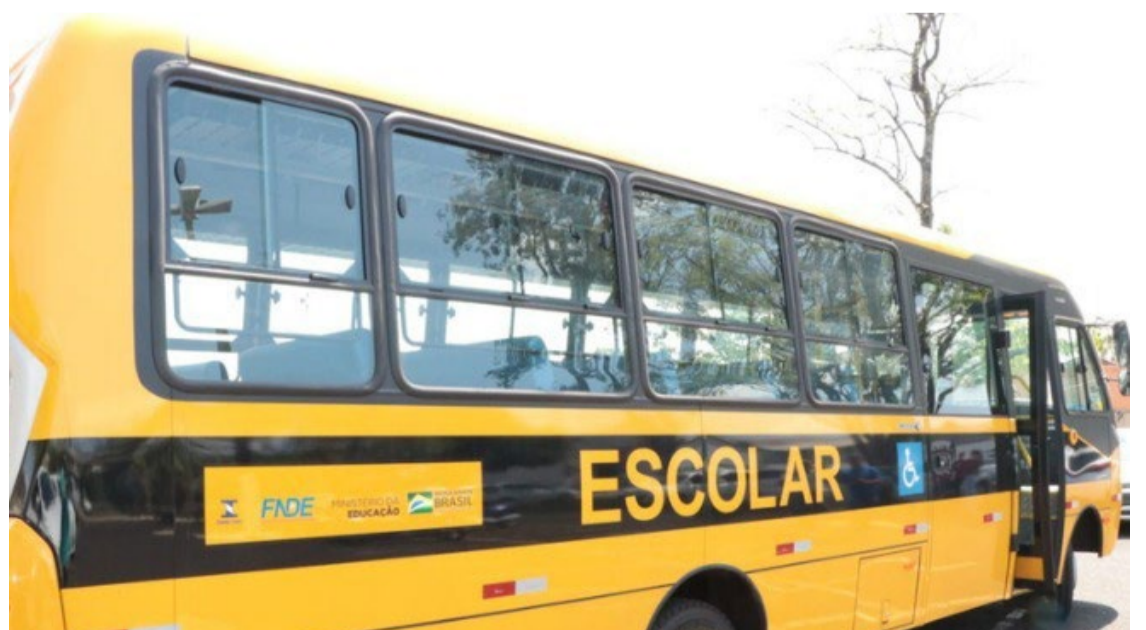
Ônibus escolares de Rio Verde estão prontos para o retorno das aulas. Frota tem 131 veículos que atendem aos estudantes da zona rural — Foto: Reprodução.

De 2017 a 2024, os investimentos realizados no transporte escolar foram de R$ 104.364.001,11.