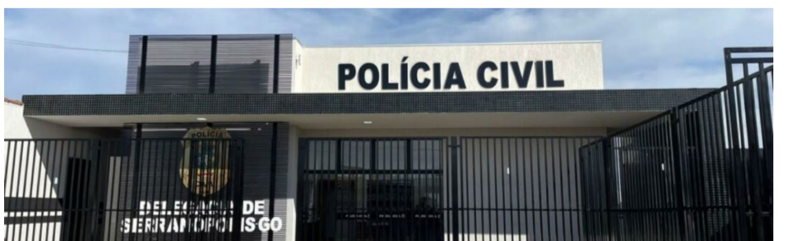
A Polícia Civil prendeu homem investigado por homicídio qualificado em Serranópolis na última na sexta-feira, 26/7 — Foto: Reprodução.

O investigado tem passagens por furto, furto qualificado, embriaguez ao volante, falsa identidade, ameaça, desacato e homicídio qualificado.