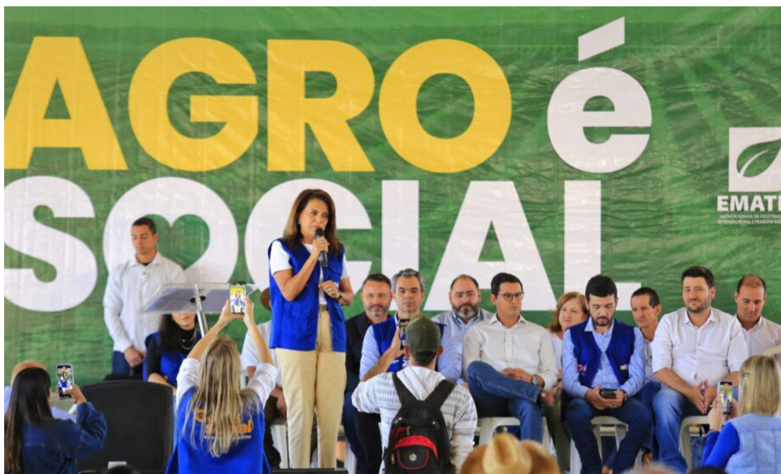
Coordenadora do Goiás Social, primeira-dama Gracinha Caiado entregou benefícios à população no último dia do Agro é Social em Itaberaí - Foto: André Saddi.

Baseado em Itaberaí, a sexta edição do Agro é Social está levando os serviços estaduais às populações pelo menos 19 municípios. A iniciativa conta com a parceria da Emater Goiás, Secretarias de Estado de Agricul-